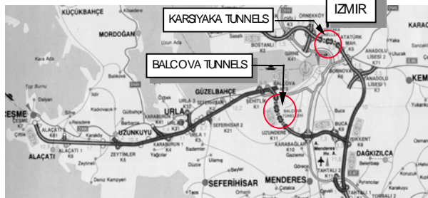
SILNIČNÍ OBCHVAT MĚSTA IZMIR – UMÍSTĚNÍ TUNELŮ