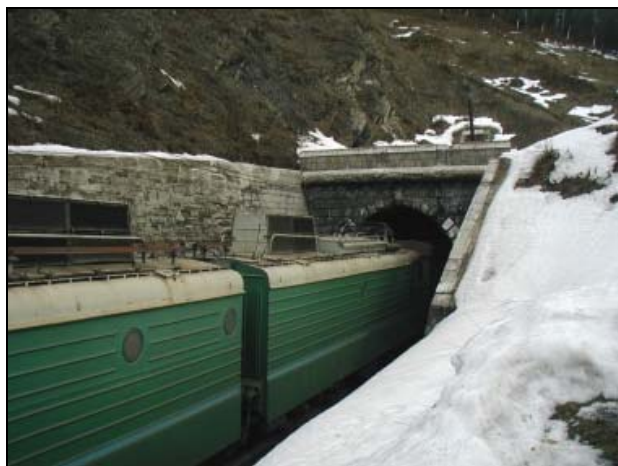
OMEZENÝ (NEDOSTATEČNÝ) PRŮJEZDNÝ PROFIL V TUNELU