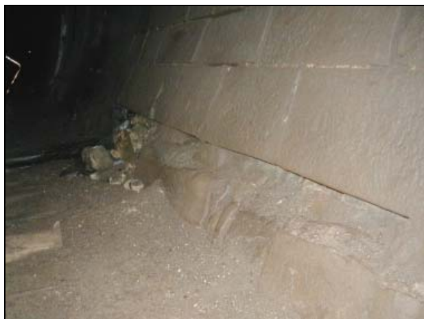
ČÁSTEČNĚ ROZPADLÉ/ERODOVANÉ ZDIVO V ZÁKLADU