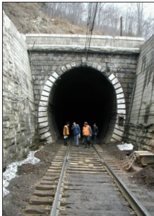
JIŽNÍ PORTÁL TUNELU BESKYD