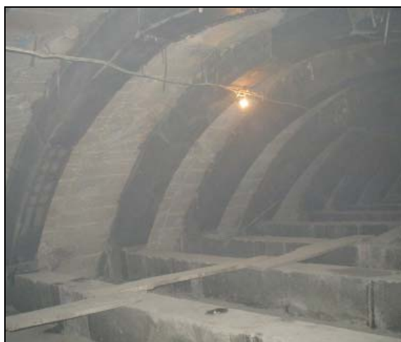
VÝTUŽNÉ RÁMY VE VĚTRACÍM KANÁLU